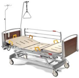
Imagen 1 / Main Picture